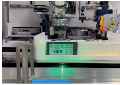
Implementação perfeita usando os leitores de código de barras existentes.