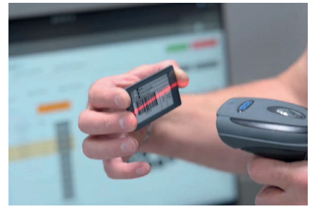
As estações de trabalho manuais podem ser adicionadas em todas as áreas do laboratório, como estoques, área revestimento ou departamento de expedição.