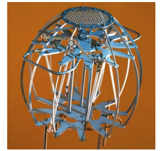
Sistema de desgaseificação portátil