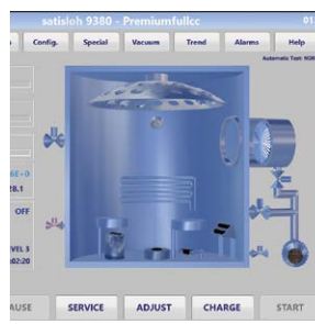
Software HMI de fácil utilização e conectividade com o Lab 4.0 ready