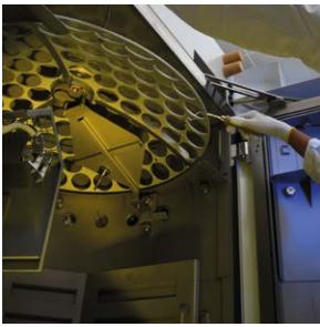
Revolucionário sistema de carregamento de lentes com domo de 3 setores