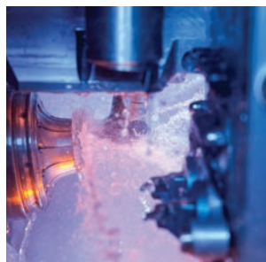
Processo de fresagem com ação única.