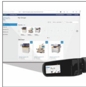
Zoom de tela de nosso headset de realidade assistida 1