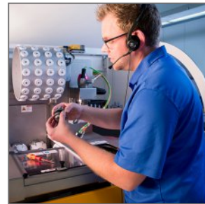
Visitas de manutenção preventiva presenciais 2

Evite o tempo de inatividade de forma proativa com suporte imediato na ponta dos seus dedos.